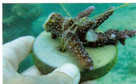
Les élèves du collège ont attaché des morceaux de corail qui avait été brisé sur des socles en ciment. Ils ont pu observer et mesurer la poussée du corail.