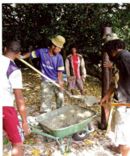
Des farès ont été construits dans le cadre d'un chantier-école par une association de jeunes des tribus environnantes.

Il faut ensuite environ quarante cinq minutes à une heure pour parcourir le sentier botanique, avec toujours les explications du guide. Faux manguier, tamanou du bord de mer... Plusieurs plantes ont été recensées avec leurs usages dans la culture kanak. Que ce soit dans l'eau ou sur terre, on ne voit pas le temps passer. Alors attention au coup de soleil ! ■