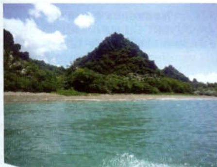
L'îlot Yeega est situé à une vingtaine de minutes en bateau des tribus de Lé-Kuunwé (Koulnoué) et Lé-Daraalik (Lindéralique).

Un masque, un tuba, des palmes et une combinaison pour plus de confort : il n'en faut pas plus pour découvrir les trésors du lagon. Rendez-vous à l'îlot Yeega à Hienghène et son sentier sous-marin, le premier en province Nord.