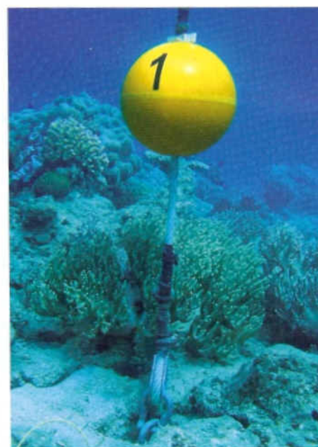
Le sentier sous-marin est balisé par plusieurs bouées avec un amarrage écologique. Pas de corps mort mais un simple crochet fixé dans les fonds marins.